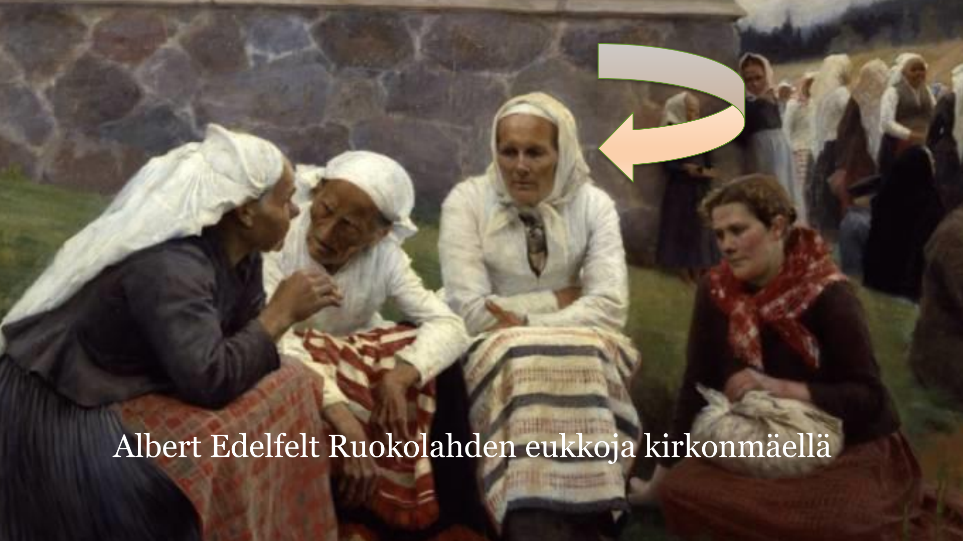
Albert Edelfelt Ruokolahden eukkoja kirkonmäellä