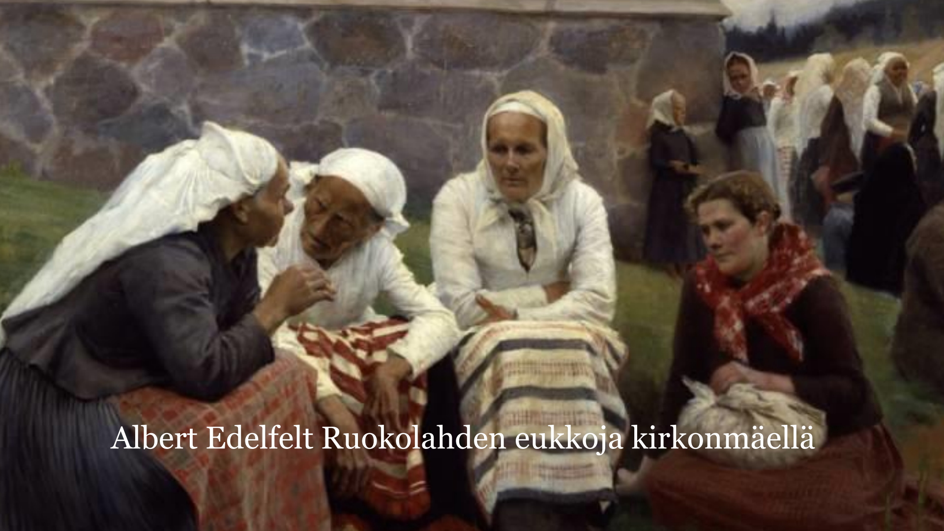
Albert Edelfelt Ruokolahden eukkoja kirkonmäellä