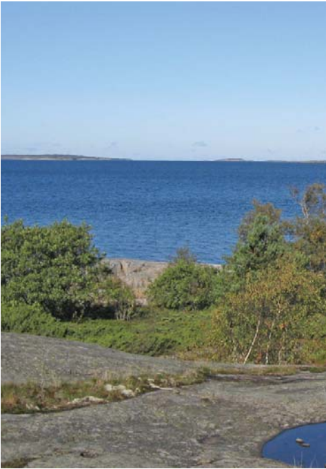
Kuva ylhäällä: Näkymät ovat pitkiä ja laajoja Saaris- tomerellä.