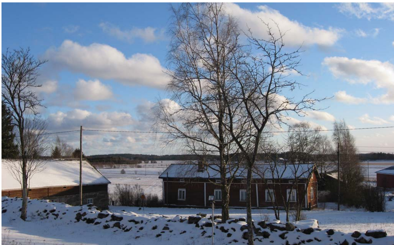
Kuva alla: Untamalan raittikylää Laitilassa