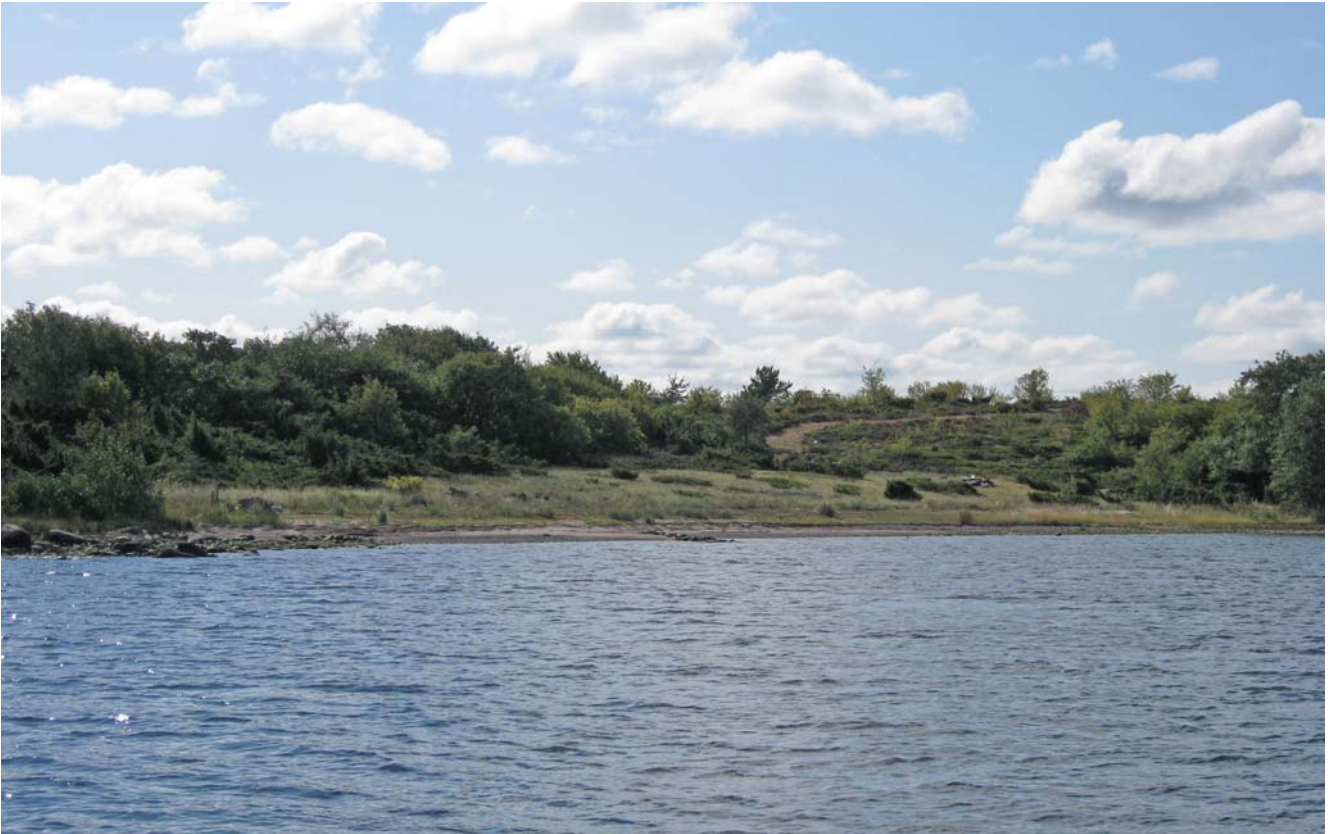
Kuva ylhäällä: Ulkosaariston tyypillistä kasvustoa, matalaa lehtipuustoa ja kanerva-kataja- nummea.