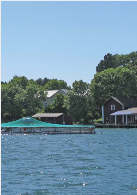
Kuva ylhäällä: Kalankasvatusaltaita Ströömillä.