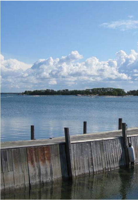
Kuva ylhäällä: Putsaaren itärannasta näkymä koilliseen.