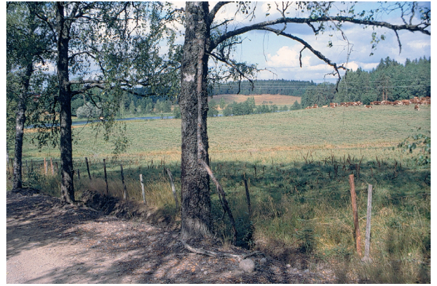
Kosken kartanon laitumia.

Alue on säilynyt yhtenäisenä ja maaseutumaisena. Viereisen selänneen ja viljellyn laakson välinen korkea tasoero korostaa sekä metsän jylhyyttä että avoimen laakson kulttuurimaisemaa. Maisemarakenteen ja maaperän monipuolisuus (moreenimäet, Salpausselkä, järviylänkö vesistöineen, kosket) kuvastuvat alueen maisemassa ja rakennetussa kulttuuriympäristössä. Talonpoikaistalot ja kartanot ovat pääosin hyvin hoidettuja.