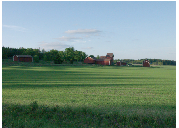
Hämeen Härkätien varren asutusta Somerolla.