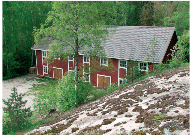
Juvankosken vanhaa teollisuusmiljöötä.

Salon itäpuolella on Lohjan-Kiskon järviylänköalueen reunaan rajautuva pohjois-etelä -suuntainen maisema-alue. Jyrkkään ja selväpiirteiseen metsäselänteeseen rajautuva alue on vanhaa kulttuurimaisemaa, jota korostavat komeat tilakeskukset. Etelässä alue rajautuu Uudenmaan maakunnan selännemetsiin. Maakuntien rajalla kulkee Kiskonjoki, jonka tasoeroa hyödyntää Kosken vanha ruukki ja myöhemmin sähkölaitos. Torkkilassa ja Ylikulmalla alue on leveimmillään. Aaljoella ja Tuohitussa se kapenee selkeäksi laaksoksi, jota Tuohitussa rajaavat Kolmas Salpausselkä ja Naarjärven PreCrag-moreeni eli vastasivun drumliini. Muurlan Kistolasta alue jatkuu länteen entisen, pelloksi kuivatetun Alasjärven tasaisena laaksona. Laakson reunoilla on vanhoja maatiloja. Muurlan Ylisjärven pohjoispuolella on laajojen viljelyaukeiden ympäröimä Ruotsalan kylä. Romsilan pohjoispuolella alue liittyy Uskelanjokilaakson maisema-alueeseen. Laajaa viljelymaisemakokonaisuutta monipuolistavat edellä mainittujen lisäksi mm. Muurlan kirkonkylä ja Ylisjärvi sekä Pullolan, Kistolan, Kaukolan ja Tuohitun kyläasutus. Alueella on myös useita kartanoita.