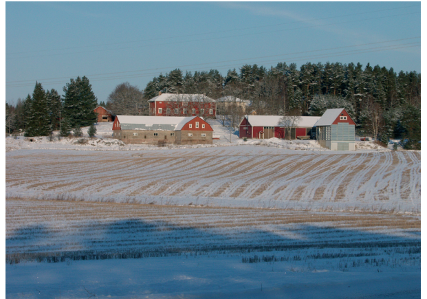
Hannun ja Sepän rakennuksia Viarin kylässä Kiskossa.