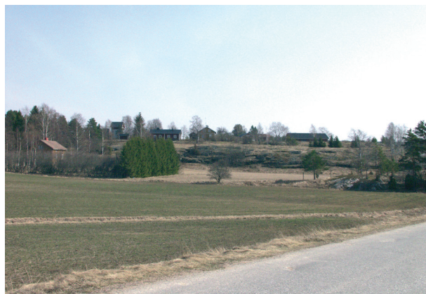
Lounaissuomalainen vanha asutus on sijoittunut tyypillisesti kalliisille kumpareille. Pohjankylä.

Alueen pohjoisosassa laakson keskellä virtaava vesistö kerää vetensä kuivatun Alasjärven pelto-ojista. Pohjankylässä joki on jo runsasvetinen ja virtaa kalliokynnyksen yli koskena. Paikalla on aikanaan ollut mylly. Pohjankylän eteläosassa on kuivattu Pohjanjärvi, joka palautuu kevättulvien ja runsaiden sateiden yhteydessä. Yliskylän kirkko ja kartano ovat alueella, jolta on löytynyt runsaasti muinaisjäännöksiä. Perniön aseman raitin liikerakennukset muodostavat tiivistä kylän-