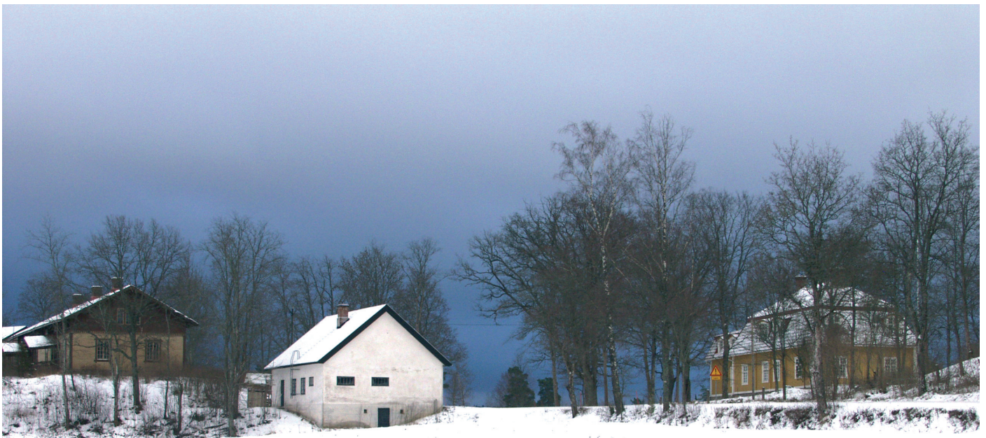
Latokartanon rakennuksia Perniössä.