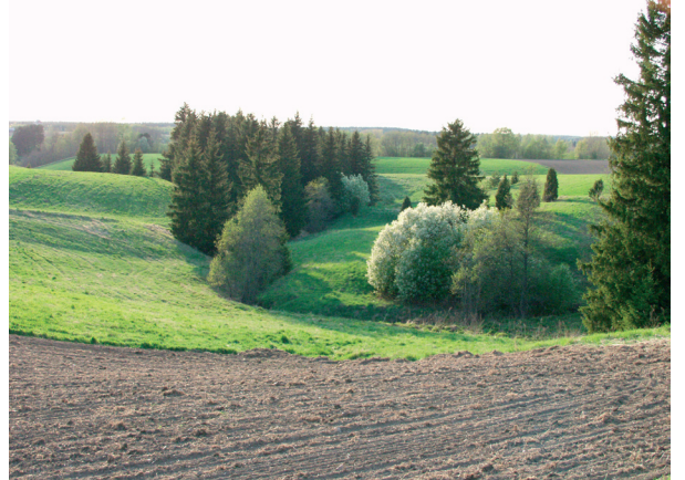
Uskelanjoen sivuhaarojen raviineja Rekijoella