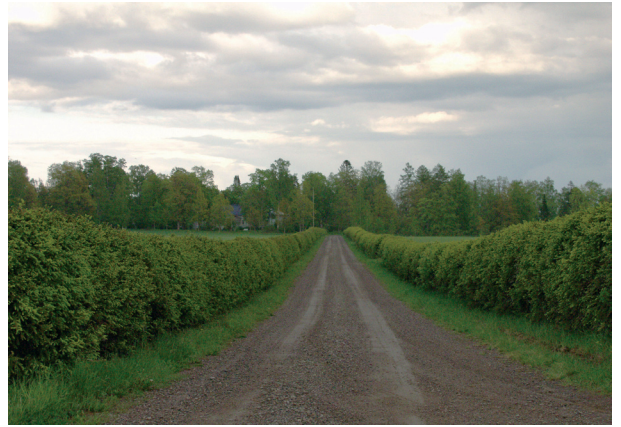
Palikaisten kartanoon johtava kuusiaitojen rajaama tie.

Someron Pitkäjärven murroslaakson maisematila on koko Suomenkin oloissa ainutlaatuinen. Harjuun liittyessään se saa karun järvisuomalaisen maiseman piirteitä. Lounais-Suomen vähävetisissä maisemissa alueen vehmaalla kasvillisuudella, pitkään jatkuneella maataloudella ja komeilla kartanoilla kehystettynä se on omintakeinen osa maakunnan kulttuurimaisemia. Vanha valtakunnallinen päätie ja sen varren kyläasutus lisäävät kulttuuriympäristön arvoa.