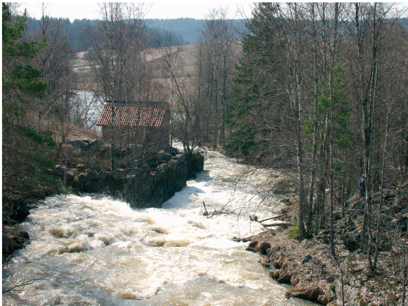
Pohjankoski Perniönjoessa Pohjankylässä.