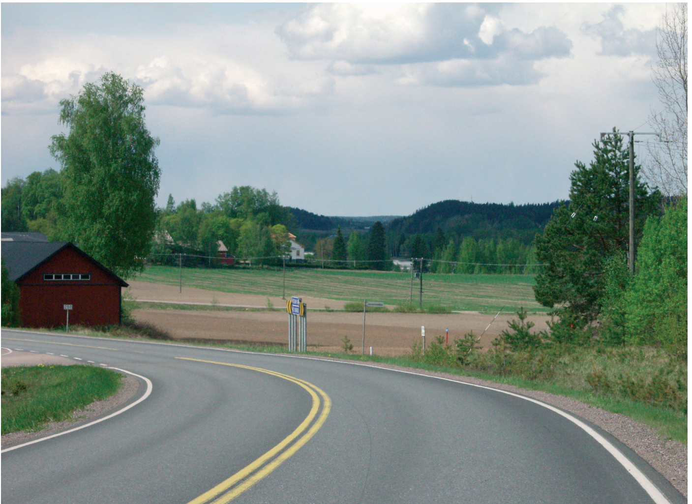
Näkymä Someron Pitkäjärvelle Somerniemien suunnasta saavuttaessa.