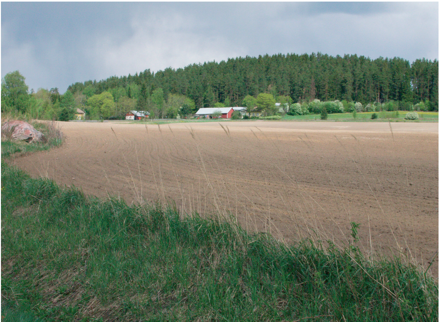
Somerniemen Viuvalan pellot ovat harjun hiekka- ja hietaliepeellä.