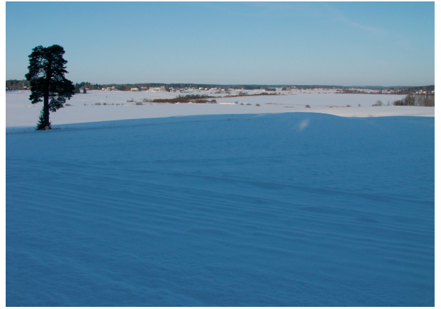
Aneriojärvi, taustalla Häntälän ja Laperlan kylät.

Maisema ja kulttuuriympäristö muodostavat vesistöjä seurailevan yhtenäisen, mutta eri tyyppisistä kokonaisuuksista muodostuvan alueen, jossa monipuolinen luonto on synnyttänyt vaihtelevaa ja omintakeista kulttuurimaisemaa. Maisematyyppi edustaa Lounais-Suomelle harvinaisempaa pienimuotoista, vesistöjen rytmittämää laaksomaisemaa. Ruukit ja vanhat kaivokset rikastavat perinteistä maanviljelysmaisemaa. Alue on säilynyt hyvin.