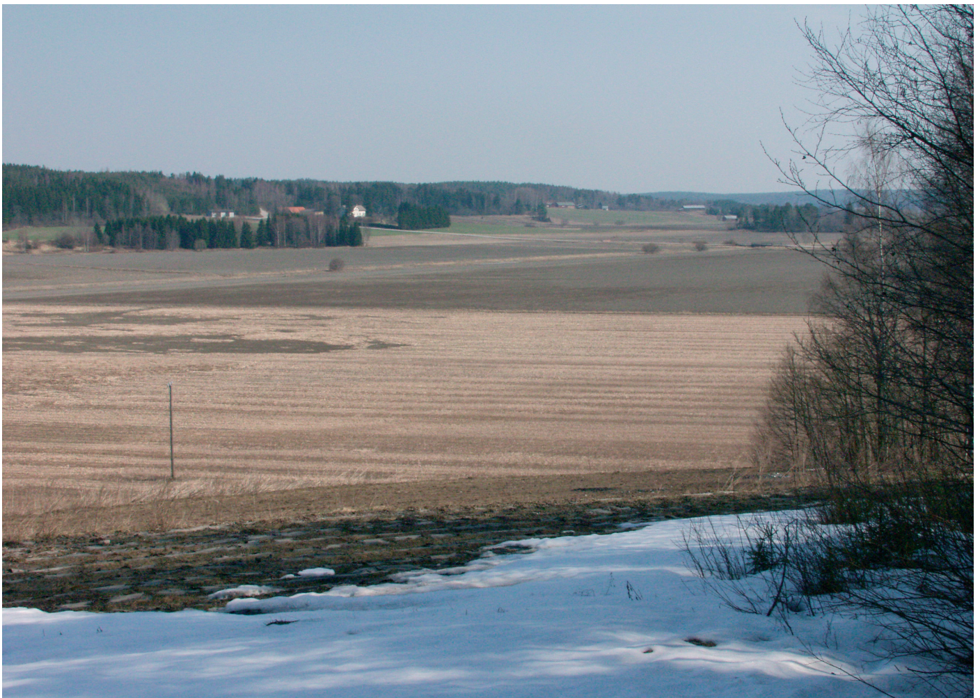
Näkymä Muurlan Alasjärven peltoaukean yli Pullolaan.