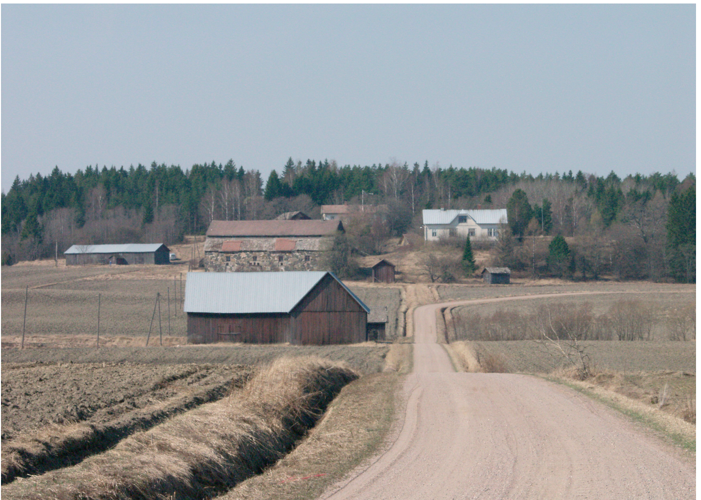
Tomman talo Alasjärven aukean länsipäässä.