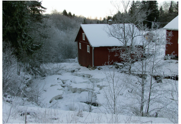
Rekijoen vanha mylly.

Alueen vanha asutus ja kylät, joista osa sijaitsee alkuperäisillä kylätonteilla, Perttelin kirkonkylä, Halikon rannikon kartanot puistoineen sekä esihistoriallisen asutuksen ja kulttuurin keskittymät: vanhat asuin- ja hautapaikat sekä vanha tiestö ovat kulttuurimaiseman arvokkaita piirteitä.