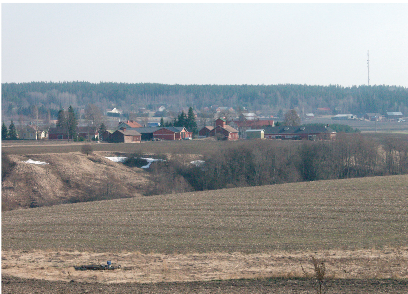
Haukkalan kylä Salossa on vanhalla kylätontilla.