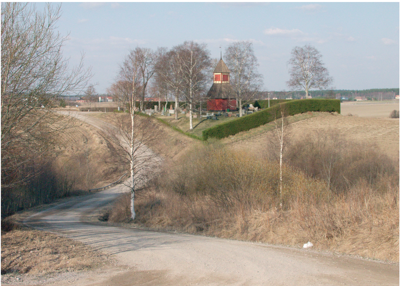
Salon vanhan emäkirkon tapuli ja kirkkotarha muinaisen rannikon kauppapaikalta Hämeen Härkätielle johtaneen Hiidentien varrella Uskelanjokilaaksossa.