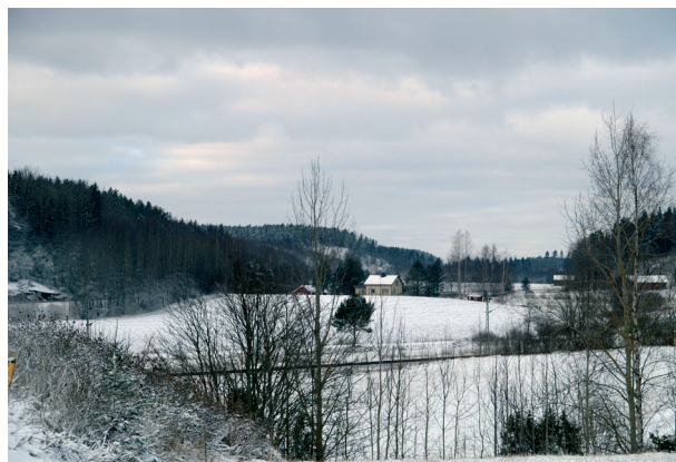
Maisema-alueen pohjoispää Pohjankylässä