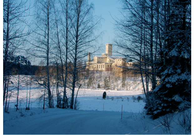
Aijalan kaivoksen tuotantorakennuksia.

Alueella on runsaasti merkkejä pitkästä historiasta, mm. kivikautisia asuinpaikkoja, 1500-luvun linnanraunio sekä varhaista teollisuutta ja kaivostoimintaa.