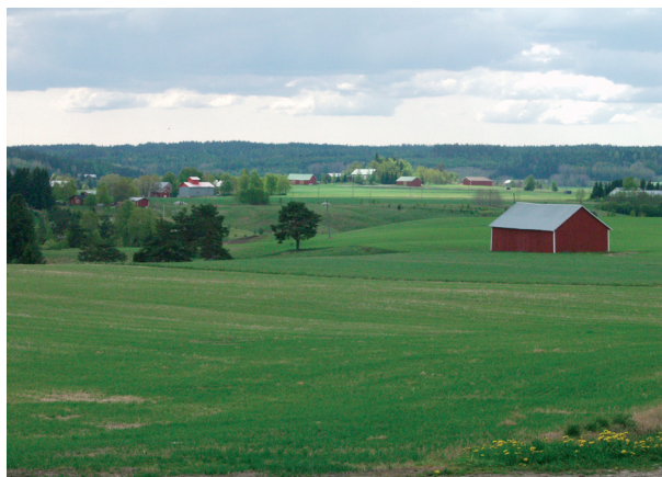
Näkymä valtakunnallisesti arvokkaalle maisema-alueelle Vaskiolla.