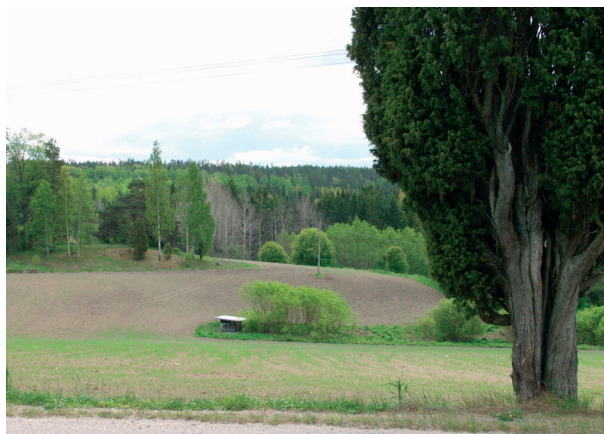
Kuusjokilaaksoa Halikon rajan tuntumassa.

Seudun maisemalliset arvot tavoittaa parhaiten vanhoilta jokia ja laaksoja seuraavilta pikkuteiltä, joista osa on seudun ikivanhaa tiestöä.