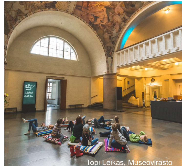
Topi Leikas, Museovirasto