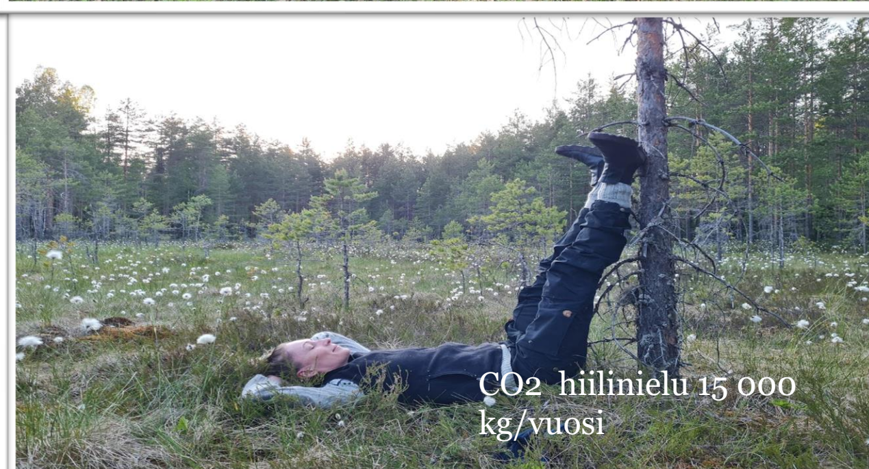
CO 2 hiilinielu 15 000 kg/vuosi