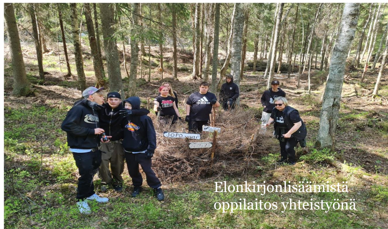
Elonkirjonlisäämistä oppilaitos yhteistyönä