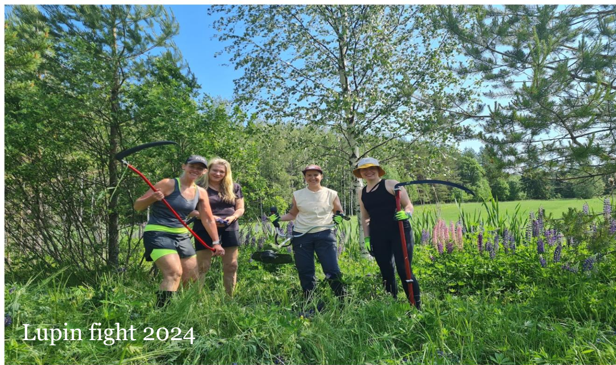
Lupin fight 2024